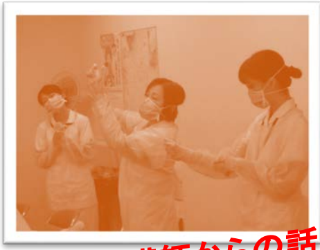
認定看護師からの話