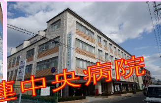
京都民医連中央病院