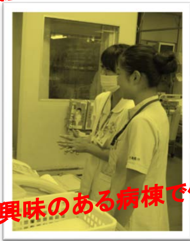
興味のある病棟で体験