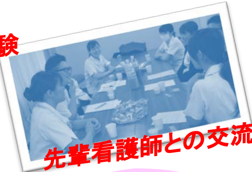
先輩看護師との交流