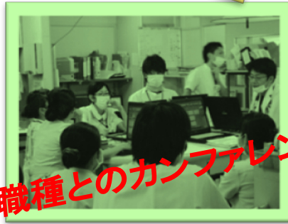
他職種とのカンファレンス